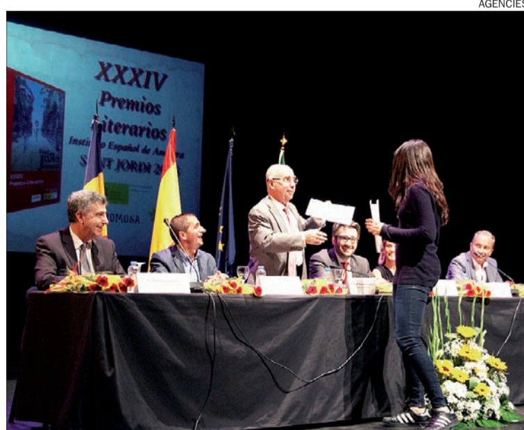
El Centre de Congressos, escenari d'una nova edició dels Premis Literaris de Sant Jordi.

La parlamentària va explicar que "l'objectiu de la demanda és tenir més informació sobre la població andorrana en relació a la seva salut mental". Aquestes dades, va indicar, "són essencials de cara a les mesures que s'han de prendre en un futur". Així, "volem saber com ho estem gestionant ara" i "quin és el cost que suposa per al país", ja que "això ens pot ajudar a pensar en quin hauria de ser el posicionament del nostre sistema sanitari".