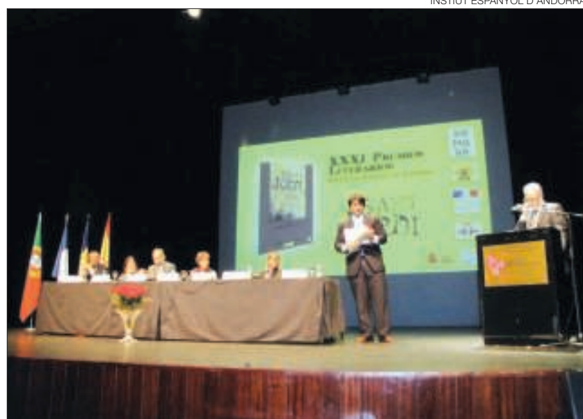
► Entrega dels Premis Literaris Sant Jordi d'una edició anterior.

El concurs l'organitza el Departament de Llengua Castellana i Literatura de l'institut, i compta amb la col·laboració dels Departaments de Llengua Catalana i Literatura, Llengua Francesa, Llengua anglesa i Plàstica; aquest últim com a coordinador del concurs de portades per al llibre que recull els premis guanyadors. La rellevància institucional del concurs ve avalada, a més, per la col·laboració de la Conselleria d'Educació de l'Ambaixada d'Espanya. ≡